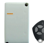
SYSTÈME RÉSEAU & GESTION TECHNIQUE BÂTIMENT