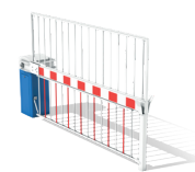
BARRIÈRE HAUTE RÉSISTANCE