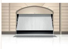
PORTE BASCULANTE Parking