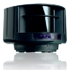
LASER DE SÉCURITÉ & D'OUVERTURE