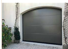
PORTE SECTIONNELLE Résidentielle & indus.