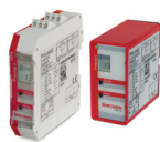
DÉTECTEUR DE BOUCLE