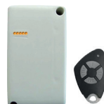
RÉCEPTEUR ET LECTEUR DE BADGE GSM