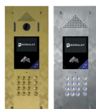
GSM À DÉFILEMENT