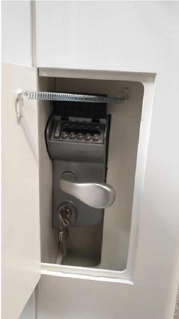
Détail du système de verrouillage MPS815